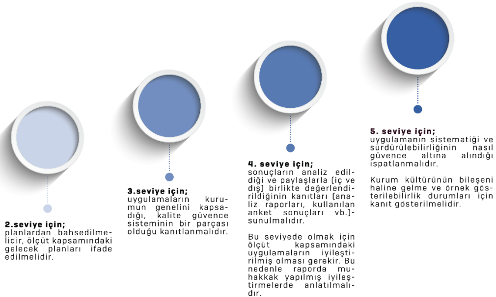
Şekil 2. Olgunluk Düzeyi Derecelendirme Basamakları